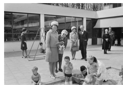
Prinses Beatrix bezoekt de Krabbebossen

De voorwerpen bij Erfgoed Juzt bestaan uit folders, naamborden, psychologische en medische instrumenten en PR materiaal, zoals een film van een bezoek van prinses Beatrix. Ook zijn er vitrines met historisch materiaal. Die erfgoed-voorwerpen zijn vaak door rechtsvoorgangers van Juzt aan Erfgoed Juzt ter beschikking gesteld of door (oud) medewerkers geschonken. Erfgoed Juzt heeft in goed overleg ook een ronde langs de te sluiten locaties van Juzt gemaakt. Zo is een groot deel van het erfgoed-materiaal veilig gesteld.