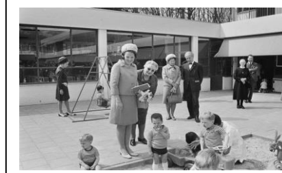
Prinses Beatrix bezoekt de Krabbebossen

De voorwerpen bij Erfgoed Juzt bestaan uit folders, naamborden, psychologische en medische instrumenten en PR-materiaal, zoals een film van een bezoek van prinses Beatrix. Ook zijn er vitrines met historisch materiaal. Die erfgoed-voorwerpen zijn vaak door Juzt of de rechtsvoorgangers aan Erfgoed Juzt ter beschikking gesteld of door (oud) medewerkers geschonken.