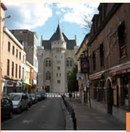
La rue Haute et la Porte de Hal Hoogstraat en Hallepoort

E lk jaar op Pinksteren dragen diverse verenigingen een beeld van Sint-Jacob van de OLV van Goede Bijstandskerk naar de OLV ter Kapellekerk. Hiermee herdenken ze een oude processie, die opgegeven werd in de 18e eeuw. Ook in de Kapellekerk bevindt zich een beeld van de apostel, dat in 1992 door Galicië aan de stad geschonken werd. Op de hoek tussen de Hoogstraat en de Sint-Gisleinstraat konden de pelgrims logeren in het Sint-Juliaansgasthuis. In Brussel bevonden zich nog drie soortgelijke instellingen: het Sint-Jacobsgasthuis van Overmolen, het Sint-Corneliusgasthuis (Vlaamse Steenweg) en het Sint-Laurensghasthuis (Sint-Laurensstraat). Naast de Hallepoort – laatste monumentale restant van de tweede stadsomwalling – is een granieten beeld te zien dat eer betuigt aan de pelgrims.