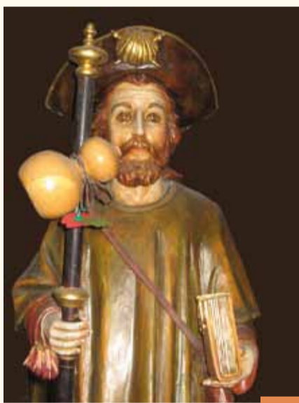
Statue de saint Jacques dans l'église de la Chapelle Beeld van Sint-Jacob in de Kapellekerk

L e samedi de Pentecôte, diverses associations portent une statue de saint Jacques entre l'église Notre-Dame de Bon Secours et celle de la Chapelle ; ils font ainsi revivre l'ancienne procession supprimée au XVIII e siècle. Notre-Dame de la Chapelle possède une statue de l'apôtre offerte par la Galice à la Ville en 1992. Non loin de là, les pèlerins pouvaient loger à l'hôpital Saint-Julien, à l'angle des rues Haute et Saint-Ghislain ; trois autres institutions du genre ont existé à Bruxelles : Saint-Jacques d'Overmolen, Saint-Corneille (rue de Flandre) et Saint-Laurent (rue Saint-Laurent). À côté de la porte de Hal, dernier vestige monumental de l'enceinte du XIV e siècle, une sculpture en granit rose (M. Paz, 1999) rend hommage aux pèlerins de Compostelle.