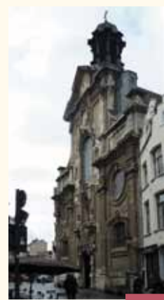
Église Notre-Dame de Bon Secours OLV van Goede Bijstandskerk

L' église baroque Notre-Dame de Bon Secours (XVII e s.) constitue le cœur du quartier Saint-Jacques, nom attribué de nos jours à la rue du Marché-au-Charbon et ses abords. Le sanctuaire fut élevé à l'emplacement de la chapelle de l'hôpital Saint-Jacques d'Overmolen. Fondé avant 1328 et fermé à la fin de l'Ancien Régime, l'institution était spécialement destinée à l'accueil des pèlerins et des voyageurs pauvres. Le portail principal de l'église a été sculpté par J.B. Tons (XVII e s.) ; on y voit les attributs du pèlerin (chapeau, besace et coquille). Le sanctuaire compte également un autel dédié à saint Jacques dans l'abside latérale droite. Sur la façade, une étoile jaune sur fond bleu indique la direction de Saint-Jacques de Compostelle.