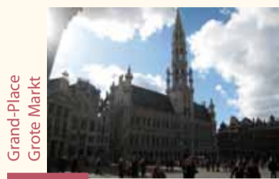
Grand-Place Grote Markt