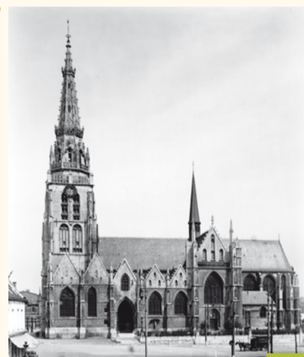
Collégiale Saints-Pierre-et-Guidon (Anderlecht) Collégiale Sint-Pieter-en-Guidokerk (Anderlecht)

A partir de l'église Notre-Dame de Bon Secours, les pèlerins peuvent opter soit pour le trajet menant aux Marolles, soit pour une déviation vers le centre ancien d'Anderlecht et la collégiale Saints-Pierre-et-Guidon, un autre lieu de culte important de la région bruxelloise. À l'angle de la rue du Marché-au-Charbon et de la rue du Jardin des Olives, deux coquilles en bronze indiquent chacune une direction. Au-delà de la porte d'Overmolen, on traversait autrefois la Senne en face de la Chapelle Notre-Dame-au-Rouge (aujourd'hui disparue), au lieu-dit 't Cruysken, rue d'Anderlecht. Pour gagner le village et la collégiale, on sortait de la ville par la porte d'Anderlecht dont l'emplacement est encore marqué par deux pavillons d'octroi du XIX e siècle.