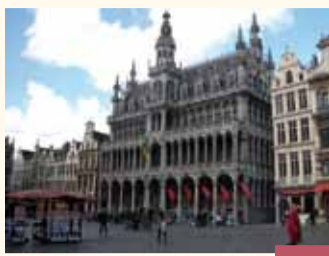
Halle aux pains Broodhuis (Maison du Roi)

Le quartier comptait également de nombreuses fontaines dont celle du Cracheur (C. Fisco, 1786), à l'angle de la rue des Pierres et de la rue du Marché-au-Charbon.