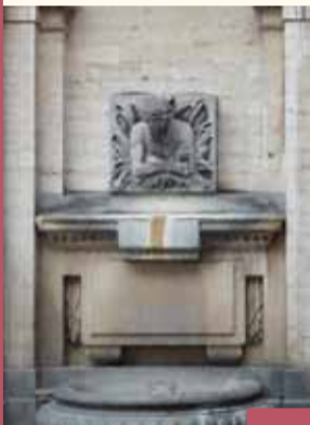
Fontaine du Cracheur «Den Spauwer» Fontein

V anaf de kathedraal begaven de pelgrims zich, via de Bergstraat, alwaar zich de Sint-Annakapel bevindt, naar de Grote Markt. Achter de barokke gevel bevindt zich vandaag echter de Magdalenakerk. Op de Grote Markt, die vanaf de 15e eeuw gedomineerd werd door het gotische stadhuis, konden de pelgrims in hun onderhoud voorzien dankzij enkele nabij gelegen hallen, zoals het Broodhuis en de Lakenhallen (Haringstraat). Bovendien bevonden er zich in de naburige straten enkele markten (Kaasmarkt, Kiekenmarkt,...). Tot slot telde de wijk tal van fontainen, zoals "den Spauwer" (C. Fisco, 1786), op de hoek van de Steenstraat en de Kolenmarkt.