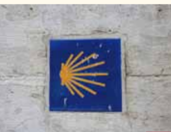
Symbole du pèlerinage Symbool van de pelgrimstocht