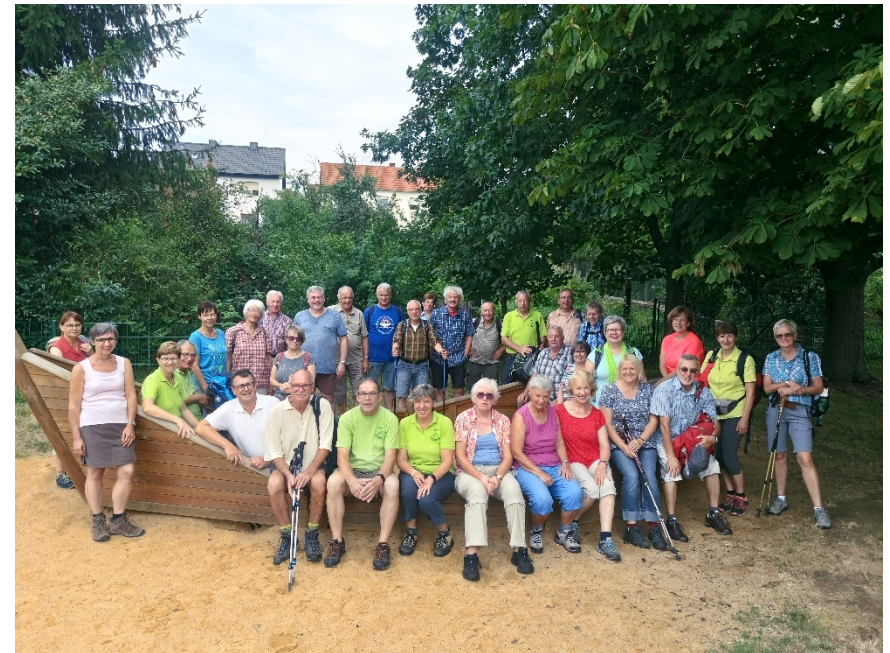
Mainfähre bei Seligenstadt