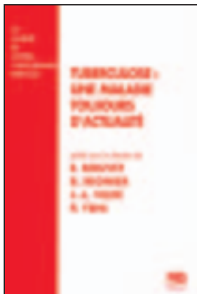
ISBN : 2-84254-077-8 154 pages