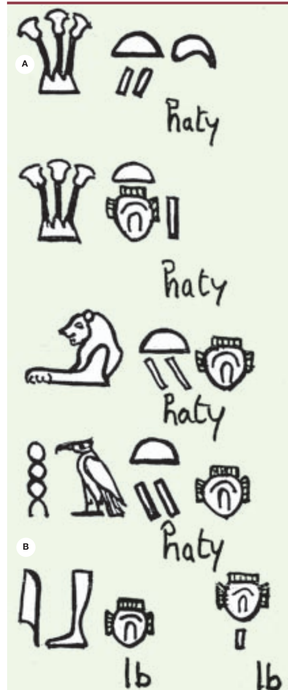
Figure 4. Le cœur et l'intérieur- ib dans les textes médicaux. A. Cœur- haty . B. Cœur- ib ou intérieur- ib (d'après B. Ziskind).

sauf le cœur- haty . Cette définition laisse entendre que dans la conception égyptienne, un organe ne pouvait fonctionner qu'en étroite association avec les autres. Ainsi, sur le plan physiopathologique, les défaillances du cœur- haty étaient considérées comme la conséquence d'une souffrance du ib qui «parlait» par son intermédiaire. L'éloignement du cœur- haty de sa base entraînait un dysfonctionnement du ib . L'interaction entre le cœur-