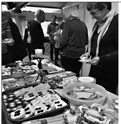
Avsluttet bibeldagen med kirkekaffe.

fått en fullstendig bibel på sitt språk. Dagens kollekt gikk derfor til bibeloversetting i Etiopia.