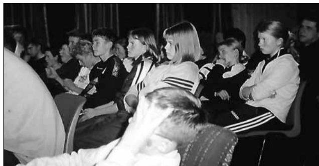
Konfirmanter på Tron ungdomssenter.