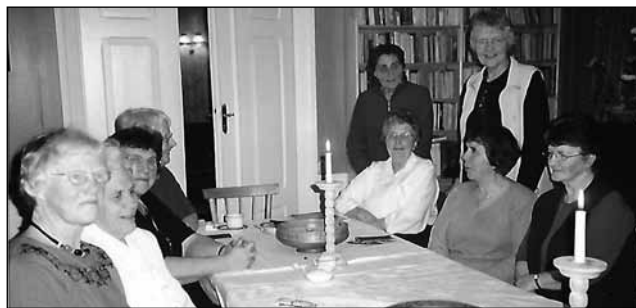
Kjente personer fra besøks-tjenesten.