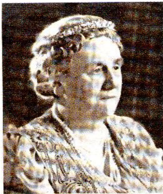
Koningin Wilhelmina vroeg iedereen: bent u vernieuwd?

Hoe kan dat? Zullen we het daar eens over hebben met Tjeenk Willink, voordat er 1,7 miljard wordt overgemaakt? Het sleutelwoord is preventie. Preventie is prachtig maar heeft de neiging door te schieten, aangezien je nog niet weet welk gevaar er precies op de loer ligt. En er zijn altijd belanghebbenden die het risico oplopen. Ik denk dan minder aan de prikstop dan aan de asbesthysterie die jaren heeft geduurd. In 2015 werd besloten dat het met de Jeugdzorg over een andere