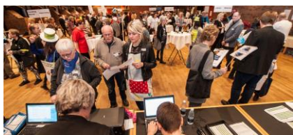
Foto fra FrivilligBørs i Esbjerg, forår 2016

FrivilligBørs refererer til en moderne møde og markedsplads, hvor byens aktører kan lære hinanden at kende, og hvor de via et kreativt, intensivt og struktureret event kan indgå nye samarbejder og partnerskaber om at give borgerne et endnu bedre tilbud.