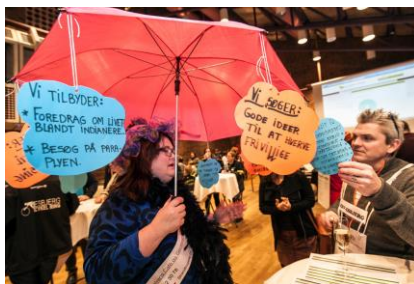
Foto fra FrivilligBørs i Esbjerg, forår 2016

Deltagerne har forud for dagen forberedt sig ved at beskrive, hvad de kan tilbyde andre – og hvad de kunne ønske sig af hjælp fra andre. Disse input samles i et børskatalog, der distribueres til deltagerne forud for arrangementet, så man kan forberede sig på at handle børsaftaler. Jo flere, jo bedre.