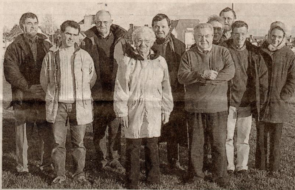
Les membres du conseil d'administration de l'association.

fois quitté le Trégor depuis longtemps de prendre des contacts. Sur ce même site, il est possible de découvrir la généalogie de 13 adhérents et le tableau de cousinage de 12 autres adhérents remontant parfois jusqu'au XVI e siècle. L'association a pour projet d'organiser en 2007 une cousinade regroupant tous les «Le Penven» ou leurs descendants, adhérents ou non de