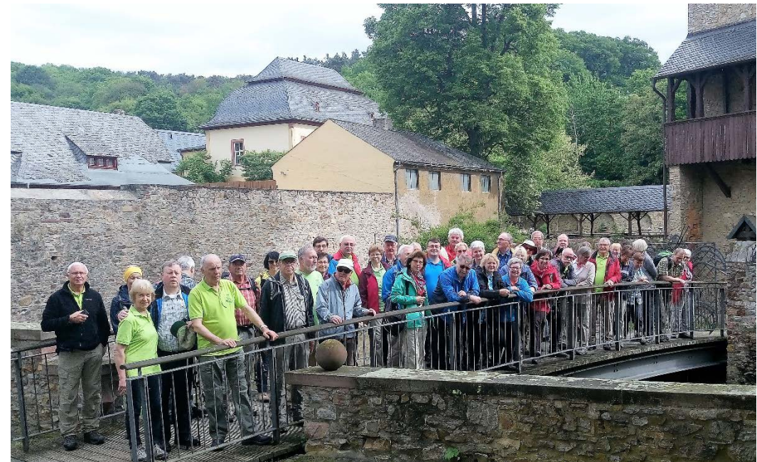
Schloss Vollrads im Rheingau