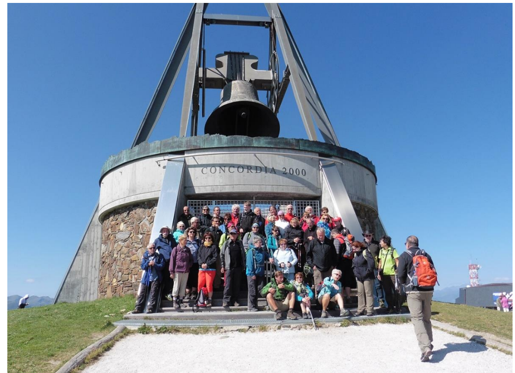
Friedensglocke auf dem Kronplatz in Südtirol