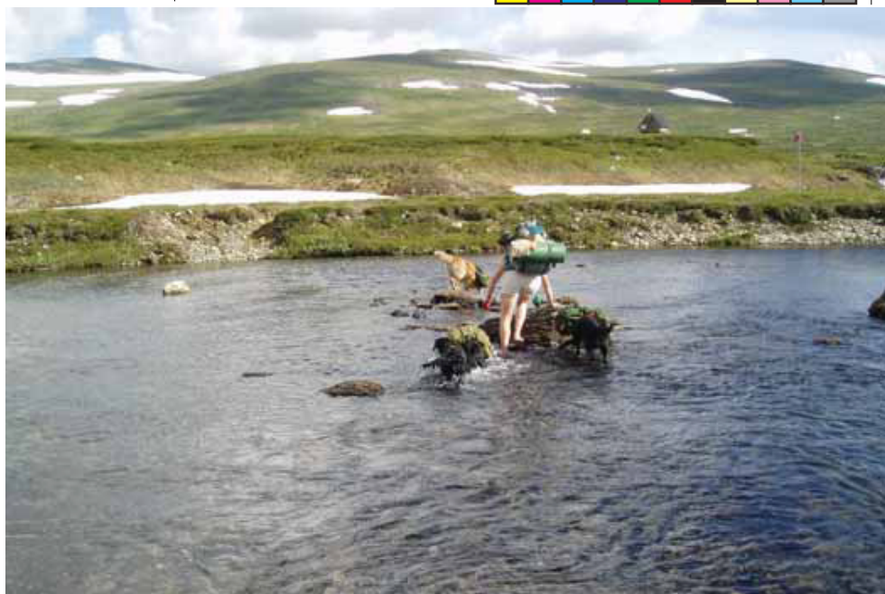
Også elver må krysses. Her ved Ljungan.

Helagsfjellene er et fjellparti det er lett å gå i, men gir ikke de helt store fjellopplevelsene for den som er glad i "klatre" litt oppover bakke for så å nyte utsikten man får over neste fjellrygg. Den som har Trollheimen som nærmeste nabo blir i så måte litt bortskjemt. Uansett, dette var en fjelltur vi hadde lyst til å gå og som gjerne anbefales til andre. Et bedre feriealternativ til deg og din firbente venn, enn en fjelltur i et eller annet fjellområde, er vi overbevist om at dere ikke kan få. Om du ikke har prøvd dette før så anbefales det på det varmeste. God tur!