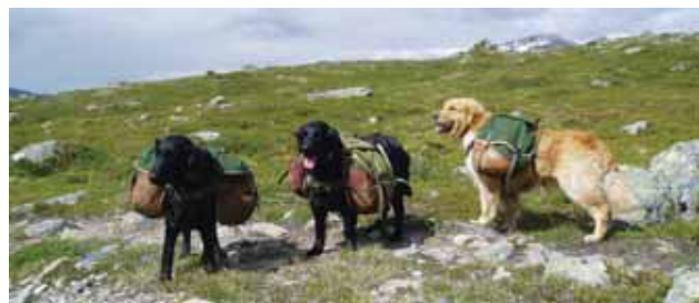
Hundene bærer fra 10-15 kg.