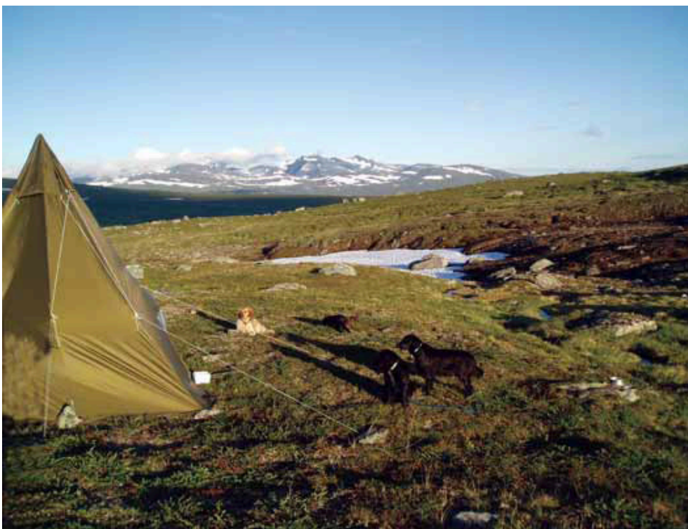
Det er kveld og tid for kveldsmat. Sylmassivet i bakgrunnen