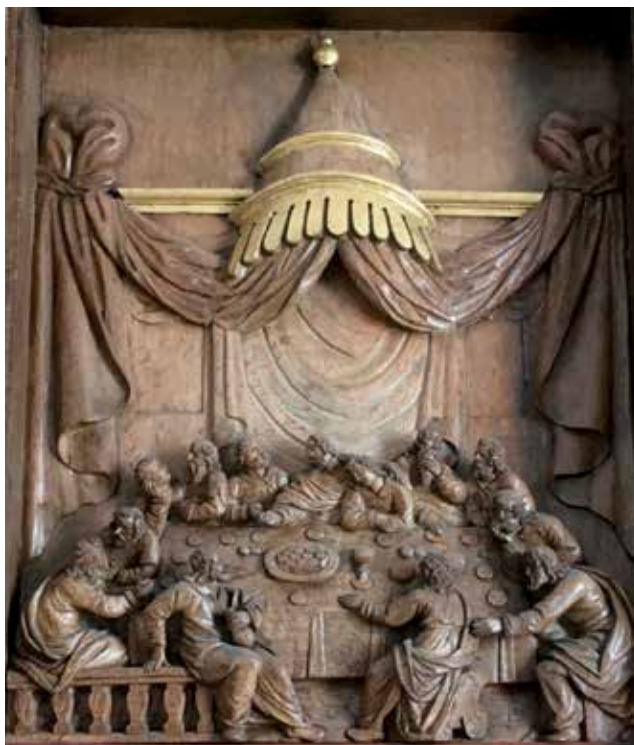
Altartavlens midterstykke. Den stammer fra midten af 1600-tallet og er muligvis lavet på Abel Schrøders værksted i Næstved

På samme måde sendte han også kalken med vin rundt for at de alle kunne drikke af den.