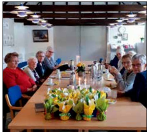
Mandagsdamerne er en stor hjælp i kirkens arbejde.