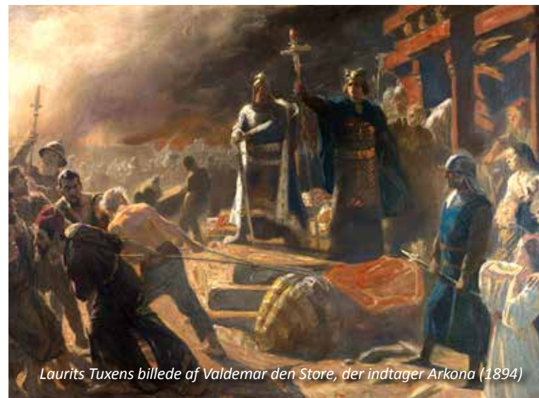
Laurits Tuxens billede af Valdemar den Store, der indtager Arkona (1894)

Alle er velkomne, og det er gratis at deltage.