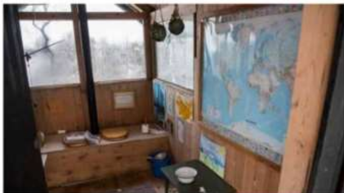
40 meter fra hytta ligger den gamle stovoven. En koselig liten bu med dobbelt de-sete, dekunst på veggene og nok av lesestoff. Her er det fortsatt noen av hyttegjestene som finner roen.