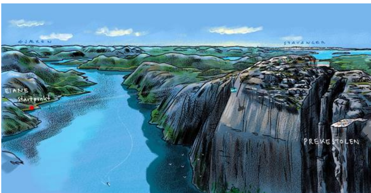
Gondolbane fra Eiane til Rygertoppen med Norges flotteste utsiktsrestaurant hvor man kan se rett til Stavanger og byøyene og Nordsjøen fra Egersund til Bømlo!