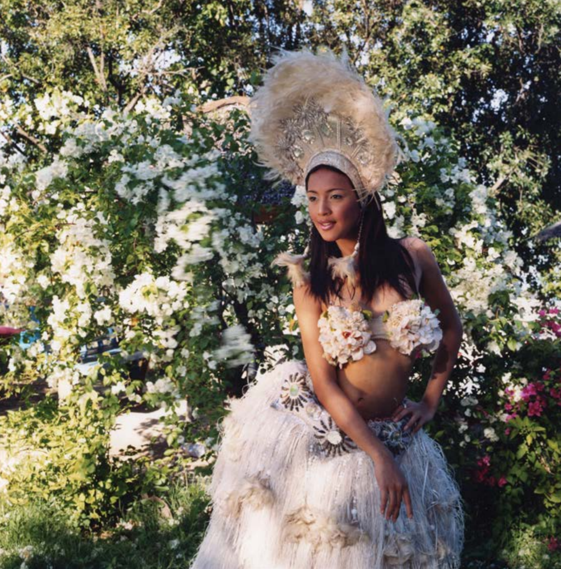
PING PING 18 | Mactan Cebù island, Philippines, 2004 Stampa Lambda cm 30 x 40