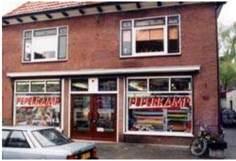
Peperkamp Modelbouw. Verlengde Maanderweg 87. Ede.