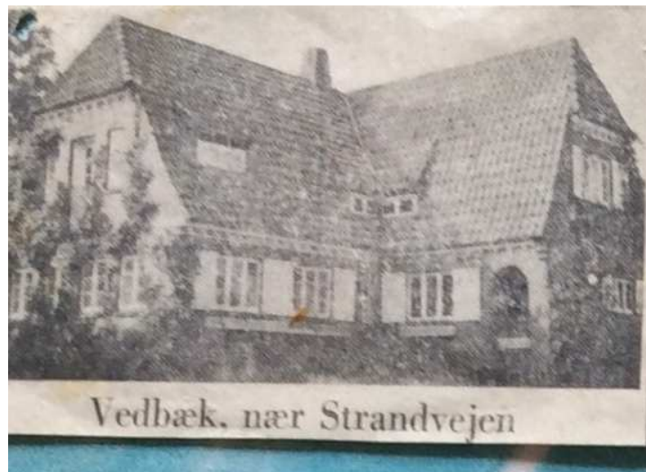
Annoncen i Berlingske