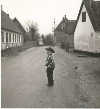
Kim på Engvej