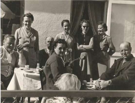
Nr. 5 på nr. 9's terrasse