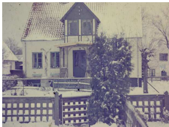
nr. 10 set fra nr. 7