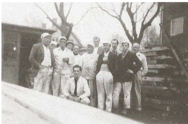
”Svendegilde”. Marievej 8. 1956