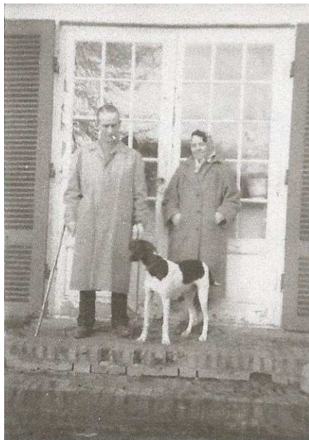
Holmevej 17. Mine forældre 1961