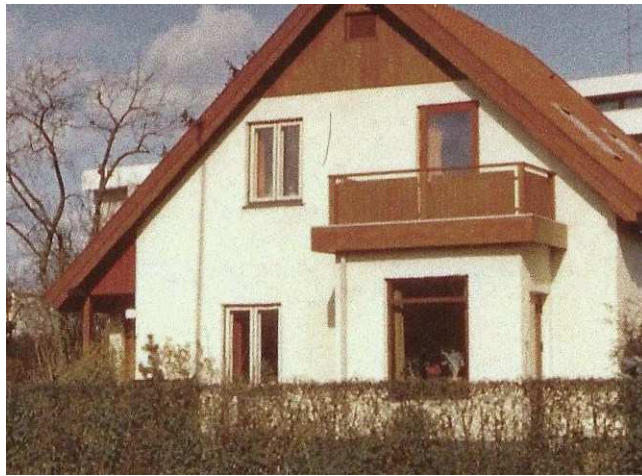
Hotelstien 4. Foråret 1973