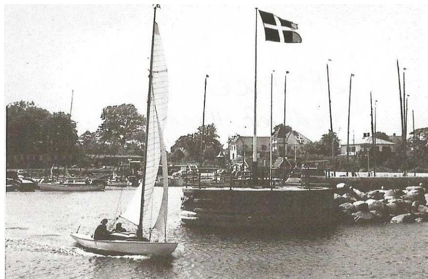
"Avance" Sommeren 1956

"Rasmine" er nok nr. 8-9 i rækken af både jeg i tidens løb har købt, haft stor glæde af, måske renoveret og solgt for at få en ny. Jeg husker sejlkubbens træningsbåd og senere den spidsgatter, der skaffede os udbetalingen til Hotelstien 4.