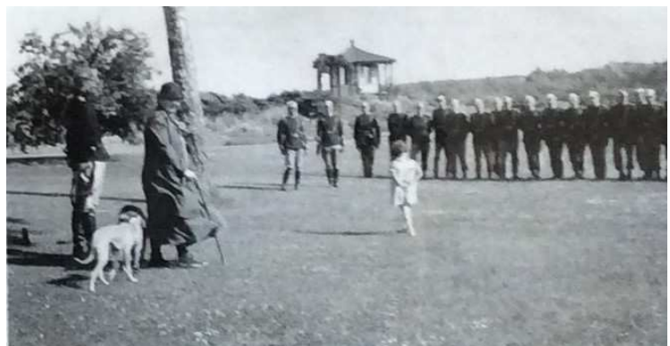
Livgarden på den årlige sommerlejr