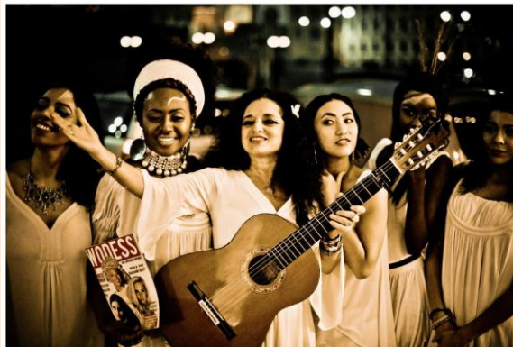
Eco Night and Homewear collection made of bamboo fabrics inspired of greek goddesses by Marja Kääriäinen Design in collaboration with WomenDesigned ForSuccess - WODESS present Multicultural Fashion LIVE show. Sponsored by Hei Helsinki Ry.

MÚSICA Cinta Hermo presenta nuevo disco.