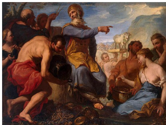
Antonio Molinari, L'Adoration du veau d'or

4300 à 2000, av. J.-C., approximativement (selon la plupart des auteurs).