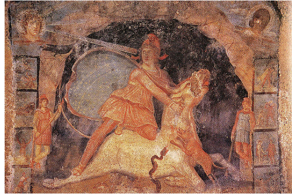
Mithra et le taureau, fresque de la ville de Marino.

La précession des équinoxes aurait été découverte par Hipparque au II e siècle av. J.-C.. C'est à cette époque que naît, en Grèce, un culte à mystères [4] , le mithraïsme. Il se diffusa pendant les siècles suivants dans tout l'Empire romain, pour atteindre son apogée durant les III e et IV e