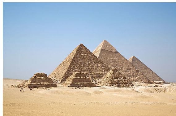
Pyramide à faces lisses de Gizeh.

Le mastaba , construction quasi rectangulaire, était la sépulture des souverains de l'Ancien Empire. Les raisons du passage des mastabas aux pyramides ne sont pas clairement établies, mais on évoque généralement le souhait d'atteindre des hauteurs de plus en plus considérables pour manifester l'importance et la puissance du pharaon défunt. Les premiers mastabas, à étage unique, ont tout d'abord évolué vers des mastabas à deux étages permettant d'accueillir de nouvelles structures funéraires, le second étage étant moins large et moins haut que le premier. Au début de la III e dynastie (vers -2700 à -2600), les mastabas sont devenus des pyramides dites à degrés , constituées de plusieurs étages successifs. La première et la plus célèbre de ces pyramides à degrés est la pyramide