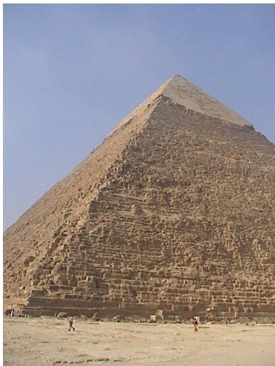
Pyramide de Khéphren.

De tout temps, ces gigantesques constructions de pierre