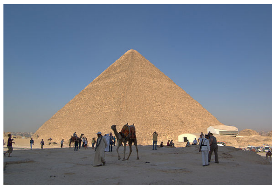
Pyramide de Khéops.

La Grande pyramide de Khéops est sans nul doute la pyramide la plus célèbre. Formant une pyramide carrée de 137 m de hauteur (initialement de 146 m, c'est-à-dire plus haute que la basilique Saint-Pierre à Rome (139 m)), elle fut édifée il y a plus de 4500 ans, sous la IV e dynastie, au centre d'un vaste complexe funéraire se situant à Gizeh. Elle est la seule des sept merveilles du monde de l'Antiquité à avoir survécu.