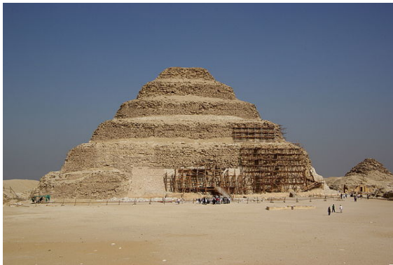
Pyramide à degré de Djéser.

Le mastaba , construction quasi rectangulaire, était la sépulture des souverains de l'Ancien Empire. Les raisons du passage des mastabas aux pyramides ne sont pas clairement établies, mais on évoque généralement le souhait d'atteindre des hauteurs de plus en plus considérables pour manifester l'importance et la puissance du pharaon défunt. Les premiers mastabas, à étage unique, ont tout d'abord évolué vers des mastabas à deux étages permettant d'accueillir de nouvelles structures funéraires, le second étage étant moins large et moins haut que le premier. Au début de la III e dynastie (vers -2700 à -2600), les mastabas sont devenus des pyramides dites à degrés , constituées de plusieurs étages successifs. La première et la plus célèbre de ces pyramides à degrés est la pyramide