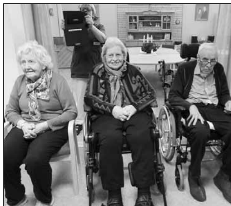
Avskjed med beboere på Solsida.

rakt en «passe STOR» kaffekopp med engel på- så kan jeg se på den og huske på dem som bor og jobber på Solsida- og det kommer pensjonisten til å gjøre med glede!