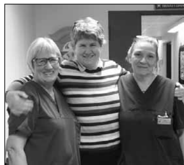
Fra kirke- kaffen etter avskjeds- guds- tjenesten.

Avskjedene har vært mange og grun- dige- for det har også vært avskjed med prestekollegiet, i Egnund kapell og i Foll- dal.