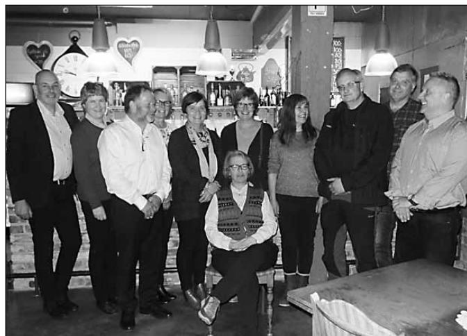
Sokneråd og ansatte på Huldra.

Det ble tatt avskjed også på Solsida Om-sorgsheim med kaffe og bløtkake etter andakten, og der fikk presten over-