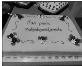
Marsipankake med avskjedstekst.