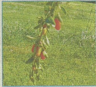
Le goji est un puissant antioxydant. Il est aussi riche en vitamines et en minéraux. (AG)