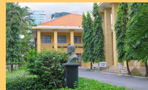
Musée Yersin, Nha Trang (Vietnam)

D'autres projets sont en préparation plus ou moins avancée. Grâce à son réseau établi en Suisse et à l'étranger l'AAAYS est bien placée pour remplir les missions qu'elle s'est assignées.