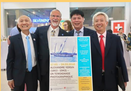
Exposition de photos à Saïgon en mars 2018 : un premier succès !