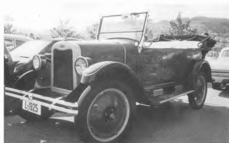
En fin representant for de virkelig fiine årganger: Chevrolet 1925.