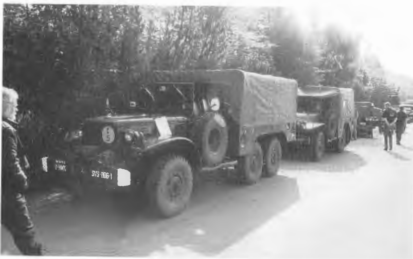
Militærkjøretøyer var også godt representert på bilutstillingen.

I tillegg til alle de fine utstilte bilene var det to haller på området: Den ene var hallen med bilstereo der også konkurransene ble holdt på lørdagen. Den andre hallen inneholdt salgsboder med modellbiler av ulike slag og diverse bilrekvisita.