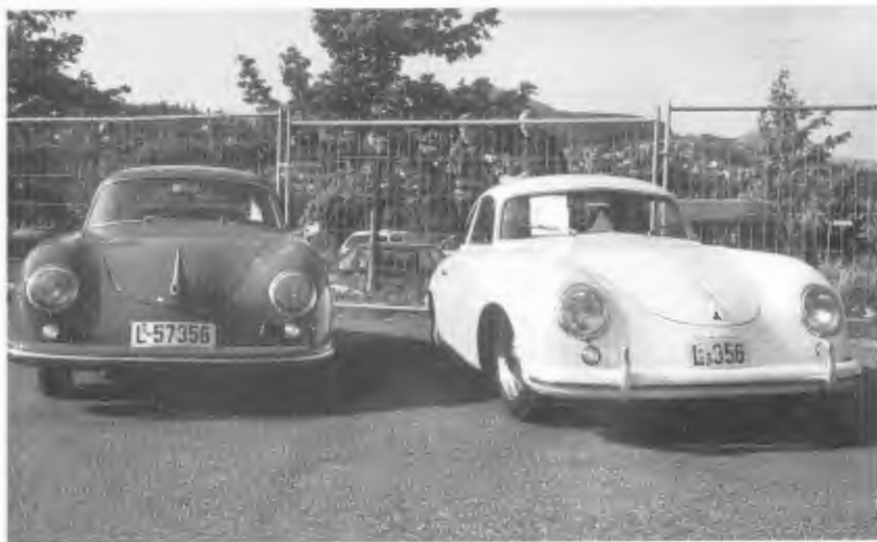
To nydelige Porsche 356'er fra 1950-tallet.

Foruten utstilling av biler var det på lørdagen konkurranser i bilstereo. De jeg snakket med i GV under arrangementet kunne ikke helt forstå at noen kunne bruke like mange penger på stereoanlegget i bilen sin som vi bruker på en fullrestaurert stasbil.