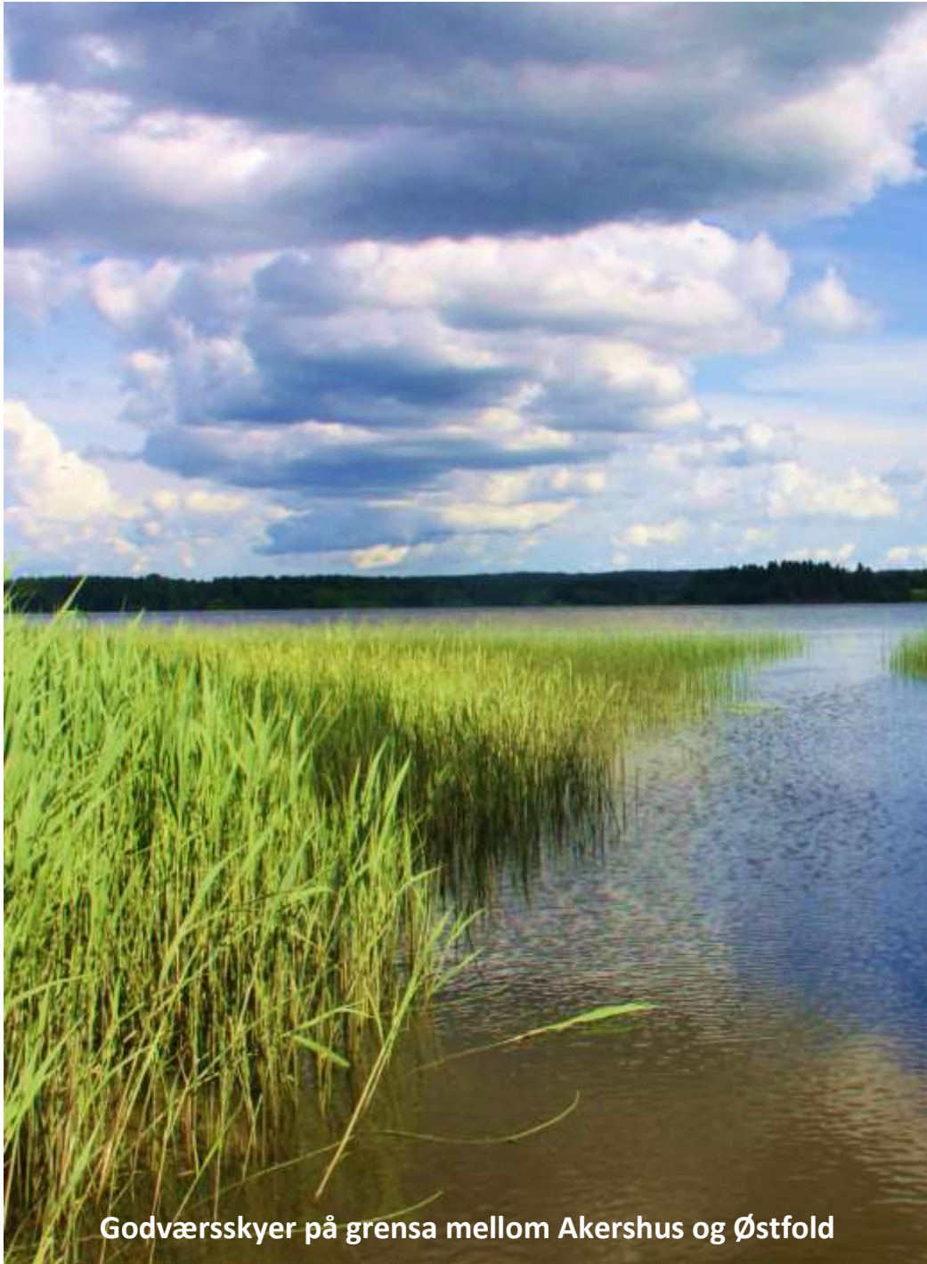
Godværsskyer på grensa mellom Akershus og Østfold