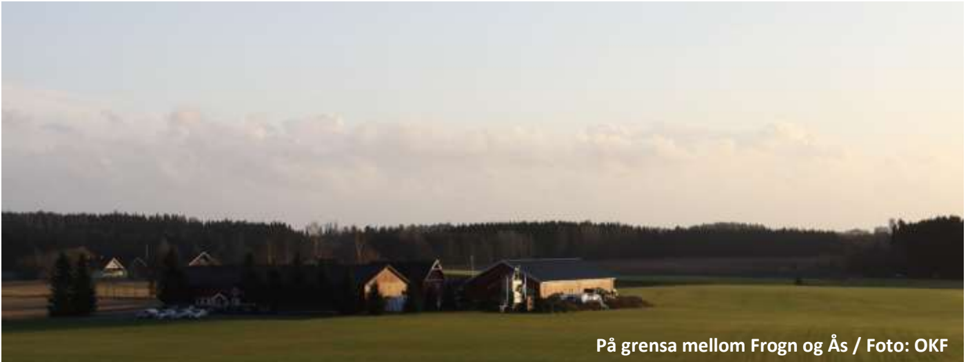
På grensa mellom Frogn og Ås