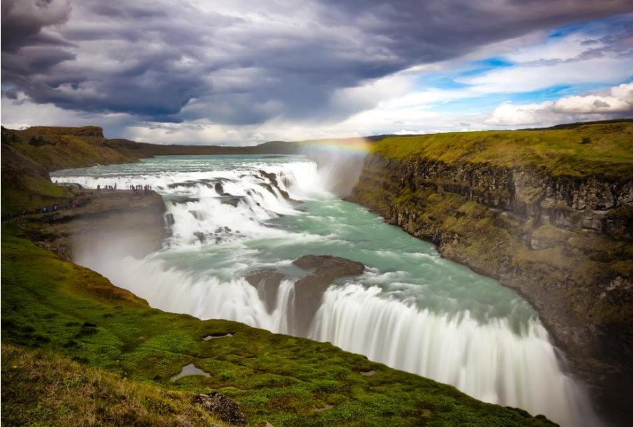
Chutes de Gullfoss

Nous quittons ce désert de glace et de feu pour rejoindre le non moins célèbre et « trop » touristique Cercle d'or mais qui vaut le détour... Aujourd'hui, 90km pour 2 heures environ. Nous devons absolument aller voir la chute d'or de Gullfoss et le geyser de Strokkur. Nous rejoignons Reykjadalur pour nous baigner dans les sources chaudes et y dormir ; C'est à 30 km.