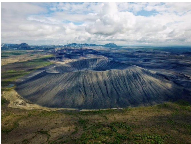
Le volcan Hverfell