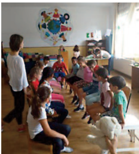
Centre de loisirs.

Partenariat avec «Scènes de Pays» service culture des Mauges. Salle de 700 places très enthousiaste grâce à cette formation survitaminée.