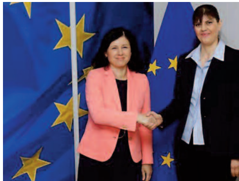
Investiture de Laura Codruța Kövesi (à droite) à la tête du nouveau Parquet européen. Et Vera Jourova, commissaire européenne à la Justice (à gauche).

Mi-septembre, alors que sa future nomination prenait forme avec le vote en sa faveur du Comité des représentants permanents (COREPER), «LCK» s'était voulue politique en expliquant