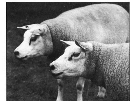
Een mooi gevormde en edele kop is het halve fokwerk, vindt Kroon. Deze sterooi 053 is daarvan een traai voorbeeld

„Als ik zie hoeveel moeite sommige fokkers doen voor het vinden van een goede ram, als ik zie met hoeveel liefde de mensen de dieren op tentoonstellingen voorbrengen, en als