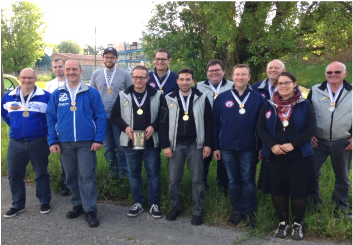
3e Les Verrières