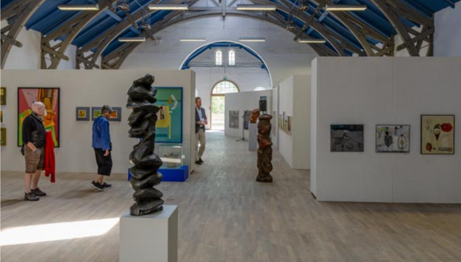
Interiør fra Ridehuset, Kunstutstilling LF 2018