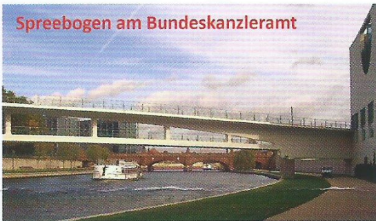
Spreebogen am Bundeskanzleramt

Ab Hauptbahnhof über 14 km zum Ziel, dem Plänterwald