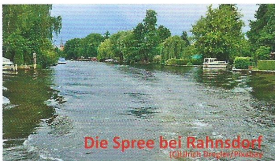
Die Spree bei Rahnsdorf

Ab S-Bf Erkner über 14 km bis zum Spreetunnel am Müggelsee