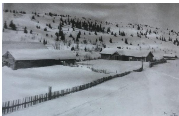
Bergskardstølen, bilde fra 1946.

Stølen er identisk, og her vil dagens eier fortelle om sin fars oppdagelse fra Tungtvannssabotørenes «besøk».