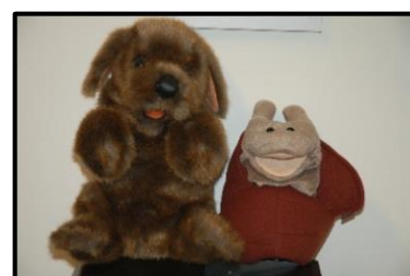
“Valp og Snegl”

SMÅSTEG har også ulike leker og sanger som forsterker de temaene vi jobber med som vi bruker i her og nå situasjoner. Disse bygger opp evnen til å mestre tanker, følelser og atferd. Dette kalles selvregulering. De øver også på ferdigheter for læring (lytte nøye, fokusere oppmerksomheten, bruke selvsnak og følge instruksjoner) og kontrollere adferden sin. Alt dette hjelper barnet med å mestre selvregulering.