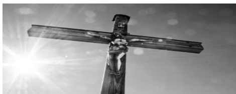
La Ressurrection de notre Seigneur