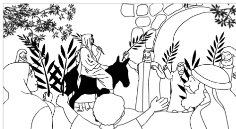
La Passion de notre Seigneur