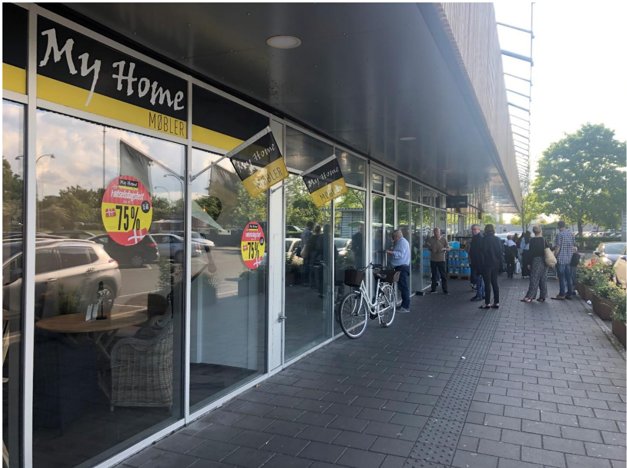
Det nye Bydelshus kommer til at ligge til venstre for Netto i Høje Gladsaxe Centret, hvor medlemmer af Seniorklubbernes bestyrelse står i billedet.